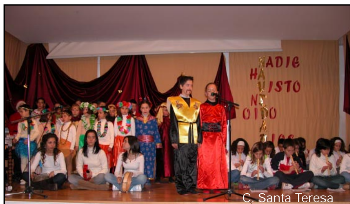
C. Santa Teresa