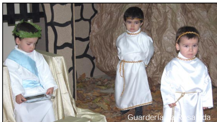
Guardería La Rosaleda