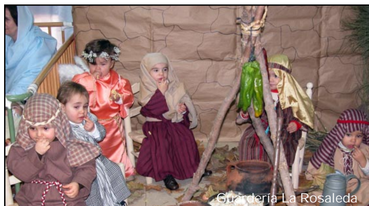
Guardería La Rosaleda